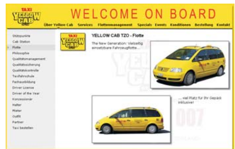
Yellowcab TZO im neuen Kleid - www.yellowcab-tzo.com

Fazit: Mit einem aktuellen Design und einer technisch korrekten Umsetzung der Website erhöhen sich die Chancen für eine gute Suchmaschinenpositionierung und somit, mehr Besucher und Interessenten über den Internetauftritt zu gewinnen.